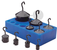
Hakengewichtssatz 9-teilig 2100 g Bestellnummer 1172047