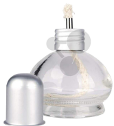
Spiritusbrenner Bestellnummer 2000014