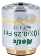
Plan-Phasenkontrastobjektiv 10x/N,A,0,25 CCIS Bestellnummer 1168747