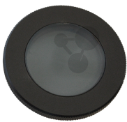
Polarisator zum Aufstecken auf Lichtaustritt Bestellnummer 1168751