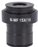
Weitfeldokular WF15x/12 plan Dioptrienversetzung Bestellnummer 1168738