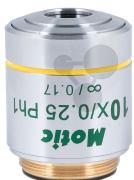
Plan-Phasenkontrastobjektiv 10x/N,A,0,25 CCIS Bestellnummer 1168747