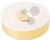
Ersatz-Silikondichtung PTFE-Stulpe GL18/8 für Hofmann 10 Stück Bestellnummer 1225025