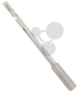
Elektrode Platin Paar Bestellnummer 1080502