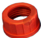
Schraubverbindungskappe mit Bohrung GL 18, 10 Stück