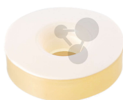
Ersatz-Silikondichtung PTFE-Stulpe GL18/8 für Hofmann 10 Stück