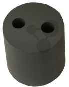
Gummistopfen 27/21mm 2 Löcher 5mm Bestellnummer 1183052