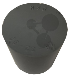
Gummistopfen 27/21mm ohne Loch Bestellnummer 1183050