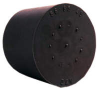
Stopfen Nitrilkautschuk 18/14mm ohne Loch Bestellnummer 1093386