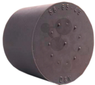
Gummistopfen 18/14mm ohne Loch Bestellnummer 1093370