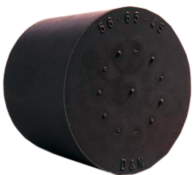
Stopfen Nitrilkautschuk 22/17mm ohne Loch Bestellnummer 1093389