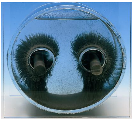
Anziehung zweier Magnete