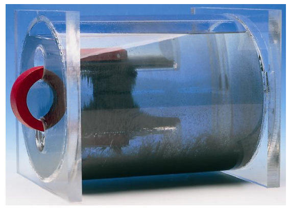
Magnetfeldlinien eines Hufeisen-Magneten

In einen Behälter aus Acrylglas, der mit einer Speziallösung (Silikonöl) gefüllt ist, sind Eisenfeilspäne eingefügt. Auf der Vorderseite befinden sich zwei Löcher, in die Magnete eingeführt werden; dadurch werden die Magnetfeld-Linien sichtbar.