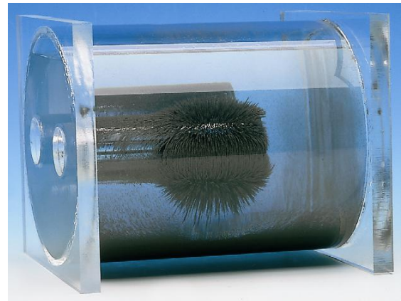
Räumliche Darstellung der Magnetfeldlinien