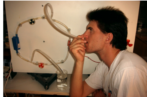
Abb. 1: Der „Energieträger-Stromkreis“

Zum Füllen des Wasserstromkreises werden die zwei Füllschläuche auf die beiden T-Stücke (5) gesteckt und Wasser aus einem wassergefüllten Becherglas durch den oberen Schlauch so lange angesaugt, bis möglichst alle Luftblasen aus dem Stromkreis entfernt sind. Dann zunächst den oberen wassergefüllten Schlauch mit der Zunge verschließen, bis der untere Schlauch mit einem der beiliegenden Stopfen verschlossen ist. Danach den oberen Schlauch mit dem zweiten Stopfen verschließen. Falls noch einzelne Blasen im Stromkreis sind, den oberen Schlauch zum Entlüften wieder öffnen und die Pumpe mit so kleiner Leistung in Betrieb nehmen, dass die Blasen zum oberen Füllschlauch geführt werden, so dass sie dort den Stromkreis verlassen können. Zum Entfernen der Füllschläuche müssen beide Schläuche zunächst verschlossen sein, dann einen nach dem anderen entfernen und dabei das jeweilige T-Stück sofort mit einem der Stopfen verschließen. Das wenige dabei austretende Wasser kann mit einem Papierhandtuch aufgefangen werden. Bei Bedarf kann dem Wasser vor dem Füllen ein wenig Farbstoff zugesetzt werden. Wird in dem Wasser eine Prise Kochsalz gelöst, kann die Algenbildung verhindert werden und der Stromkreis über längere Zeit wassergefüllt aufbewahrt werden.