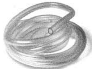
Water Turbine Pipes