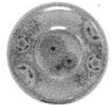
Motion Display (Gears)